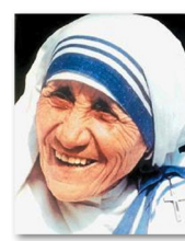
TERESA DE CALCUTA