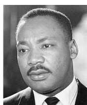
MARTIN LUTHER KING